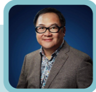
曾昭學 香港特別行政區政府「創意香港」總監

「Redress 設計大賽」通過培育新晉時裝設計師有關可持續設計的理論與技術，以推動循環時裝系統的發展，成為可持續時裝設計界的一個重要品牌。