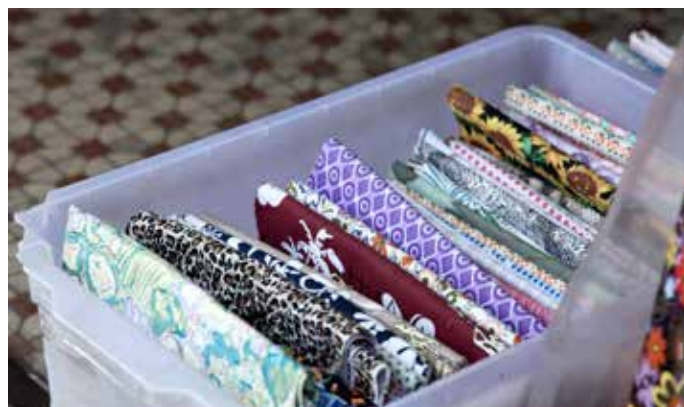
已損壞的紡織品 是未被使用或已損壞的紡織品，例如有顏色或列印缺陷的紡織品，以致不能再用。