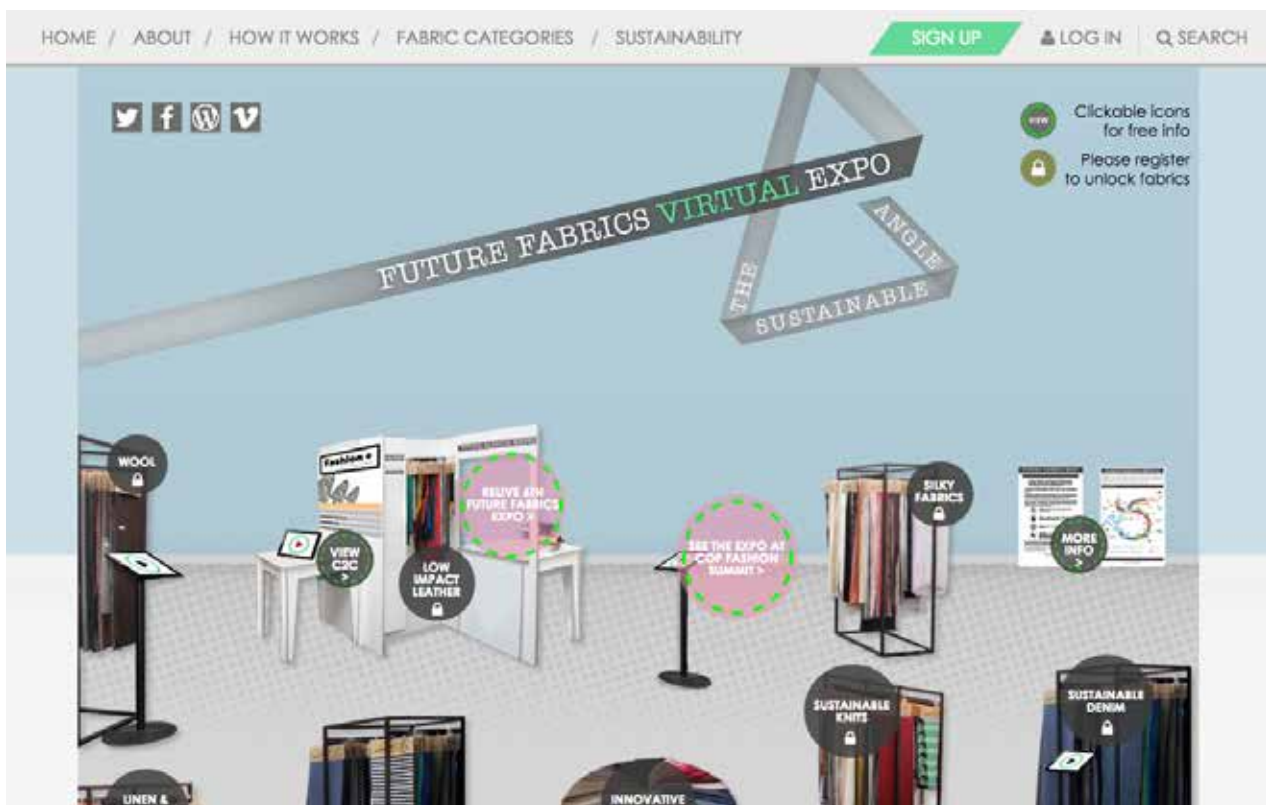
Future Fabrics Virtual Expo ( www.futurefabricsvirtualexpo.com ) 是一個網上研究及採購平台，提供可持續紡織品資料。用家可透過此平台聯繫來自世界各地的工廠。