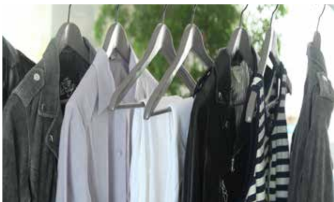
服裝樣品 是指服裝設計和生產過程中的部分整理加工或完全整理加工樣品。