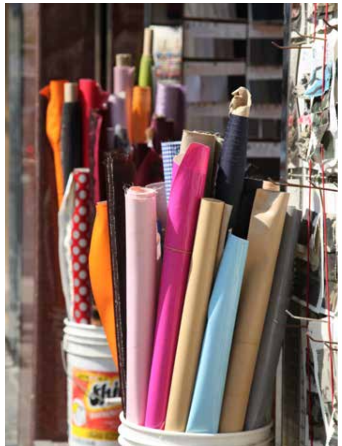
卷軸尾端布料 是成衣製造工廠的盈餘紡織品。