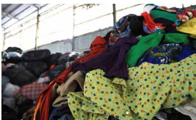
二手衣服 是任何曾被擁有過的衣物或時尚配飾，然後遭消費者棄置 (可以是使用過或未被使用過)。