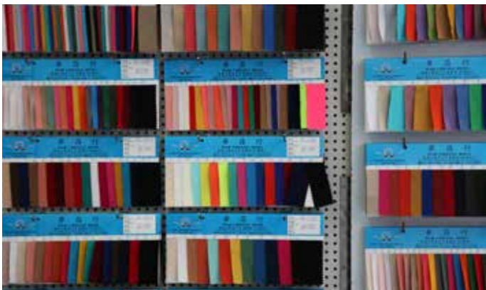
紡織色板 是指生產過程中的剩餘紡織色板樣品。