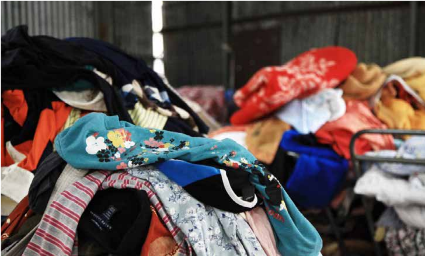
在香港的一個回收場內的紡織廢料。