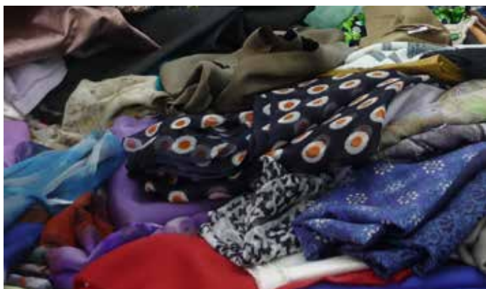
樣品廢料 是指工廠製造樣品所剩下的紡織品。