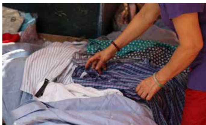
存倉成衣 是指未曾被出售的衣物(整理加工或沒有整理加工)。