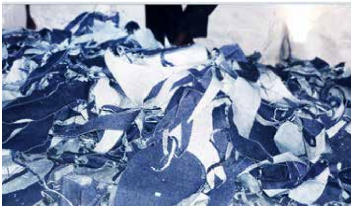
布料碎屑 是指切割和縫製成衣過程中的紡織品碎屑。