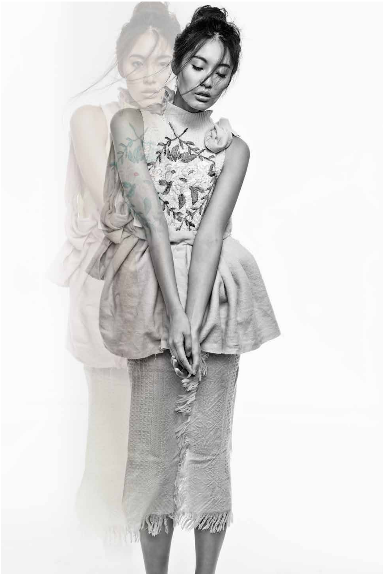
相片來源: 模特兒: 陳碧兒; 造型設計: Denise Ho; 攝影: Raul Ducasar 提供

英國設計師及「Redress 設計大賽」2013 總決賽者 Catherine Hudson 在香港一個衣物回收倉搜羅二手衣物及毛毯，在 Redress 研討會: Miele 設計師挑戰中創作出這條重新構造裙子。