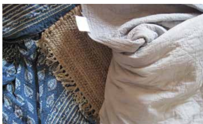
二手紡織品 是任何曾被擁有過的非衣物整理加工紡織品 (譬如窗簾、被褥等)，然後遭消費者棄置 (可以是使用過或未被使用過)。