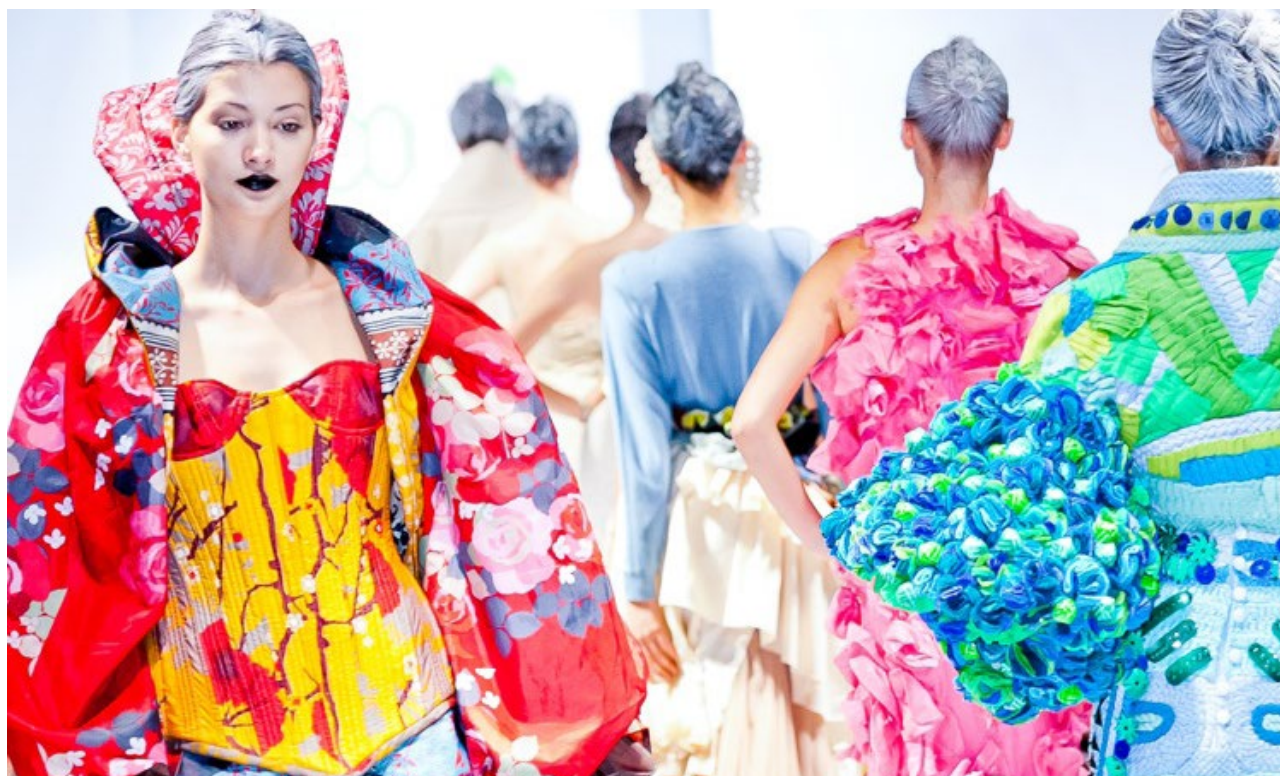
Redress 時裝表演中的升級再造服裝。